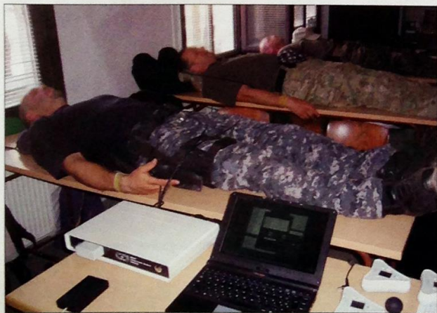
Az EMOST hivatalosan is orvosi eszköz minősítést kapott

– Számos élsportolót – egyéni és csapat sportban – kezeltünk, teljesítmény fokozó és gyógyulást serkentő céllal. A kezelésekre hatására javult a pszichés egyensúlyi állapotuk, terhelhetőségük, a koncentrációképességük. Beszámoltak arról is, hogy a kezelés hatására fájdalmak gyorsan megszűnnek, sérüléseknél jelentősen gyorsul a felépülési idő és újra terhelhető a sérült testrészt. Megjegyzendő, hogy a Saját Jel Terápia