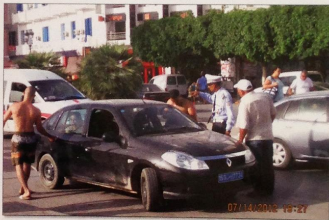
A tengerparti Sousse-ban mindenütt látható a rendőri jelenlét

A tengerparti nyaralóhelyeken különösen figyelnek a rend őrei, hogy nyugodtan pihenhessenek a turisták. Turisztikai rendőrök tűntek