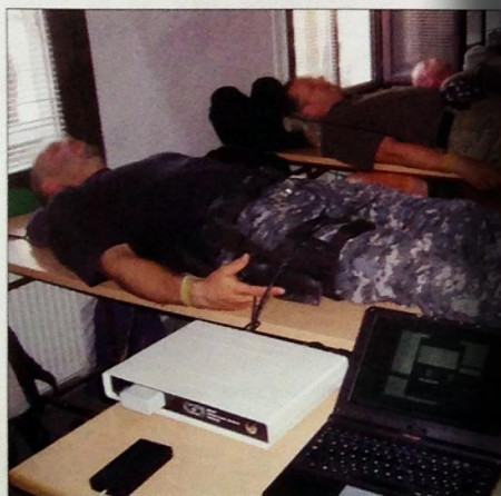
Az EMOST hivatalosan is orvosi eszköz minősítést kapott

hatékony technikák az ártalmas stressz ellen.